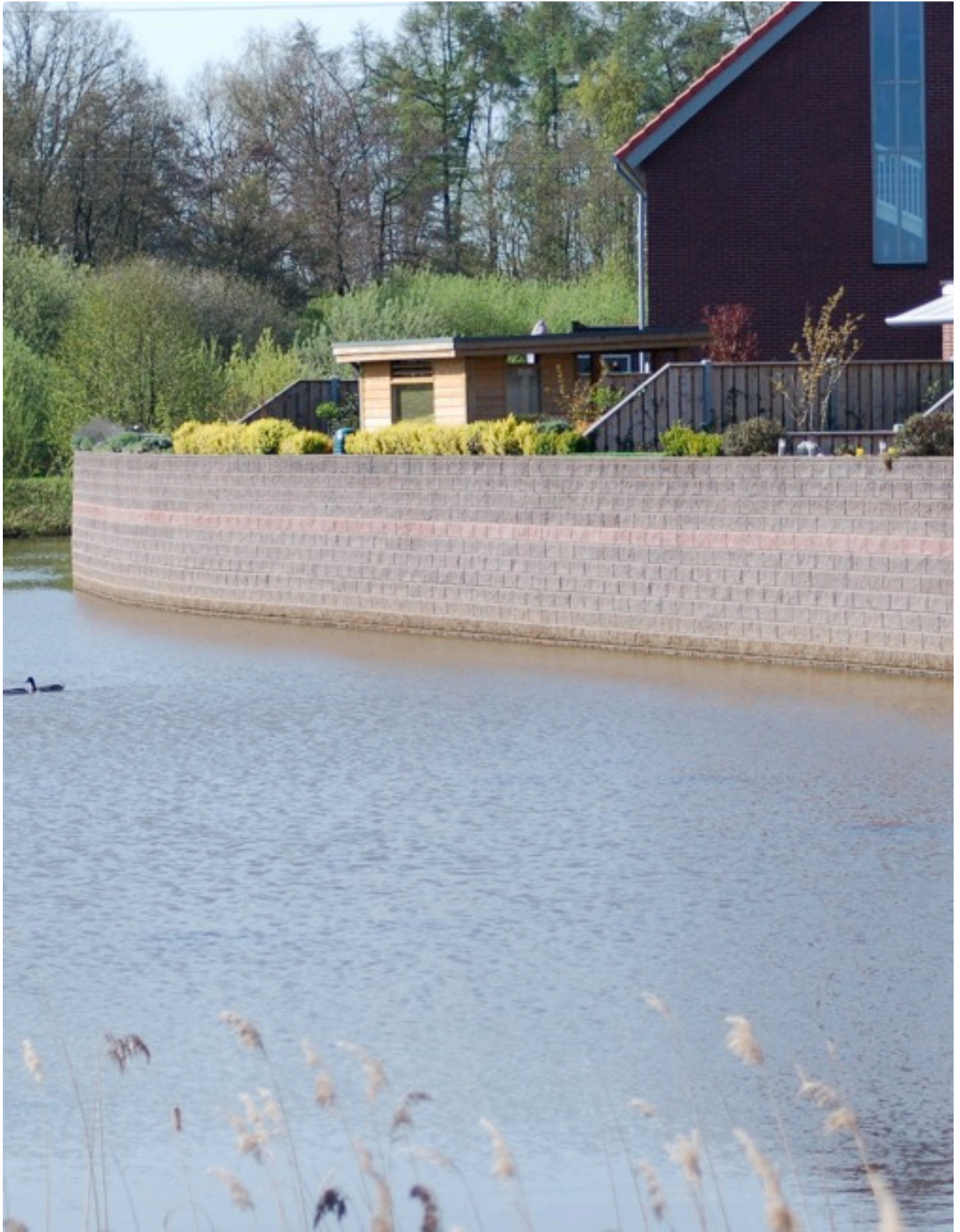
Slangemuur “Nijrees” – Almelo