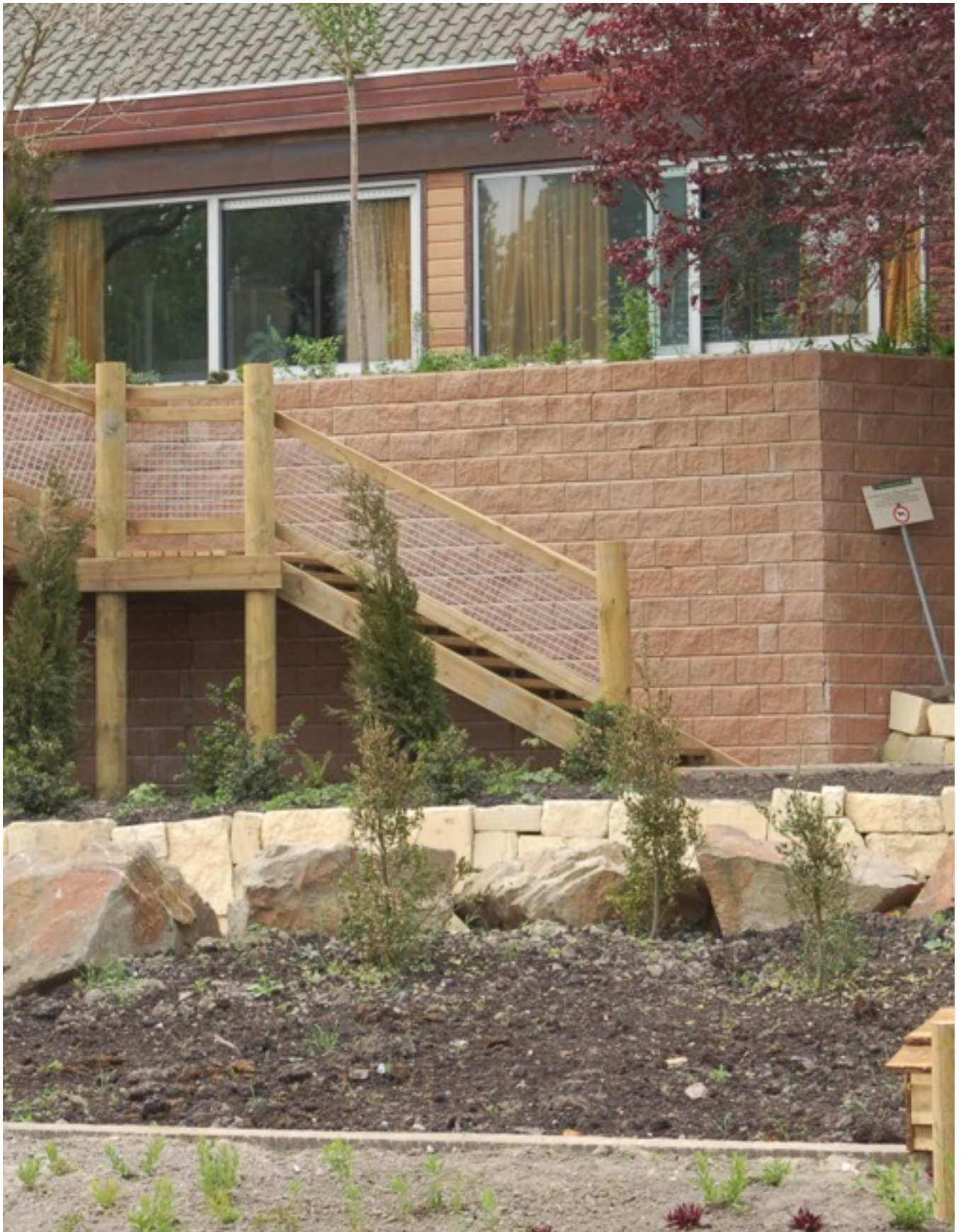
Vogelpark Avifauna - Alphen a/d Rijn