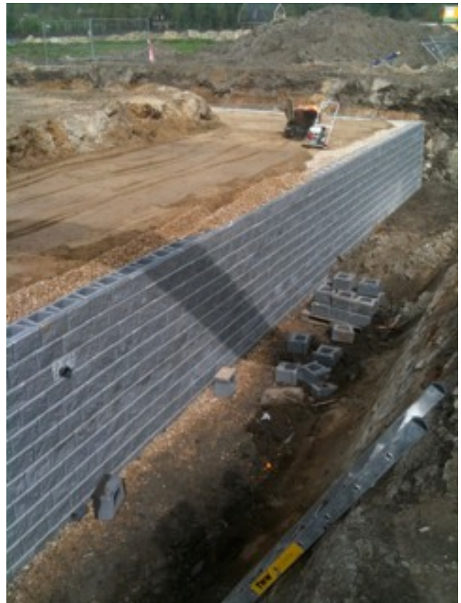
Totaal 730 m 2 Allan Blocks Maximaal kerende hoogte 3,40 m