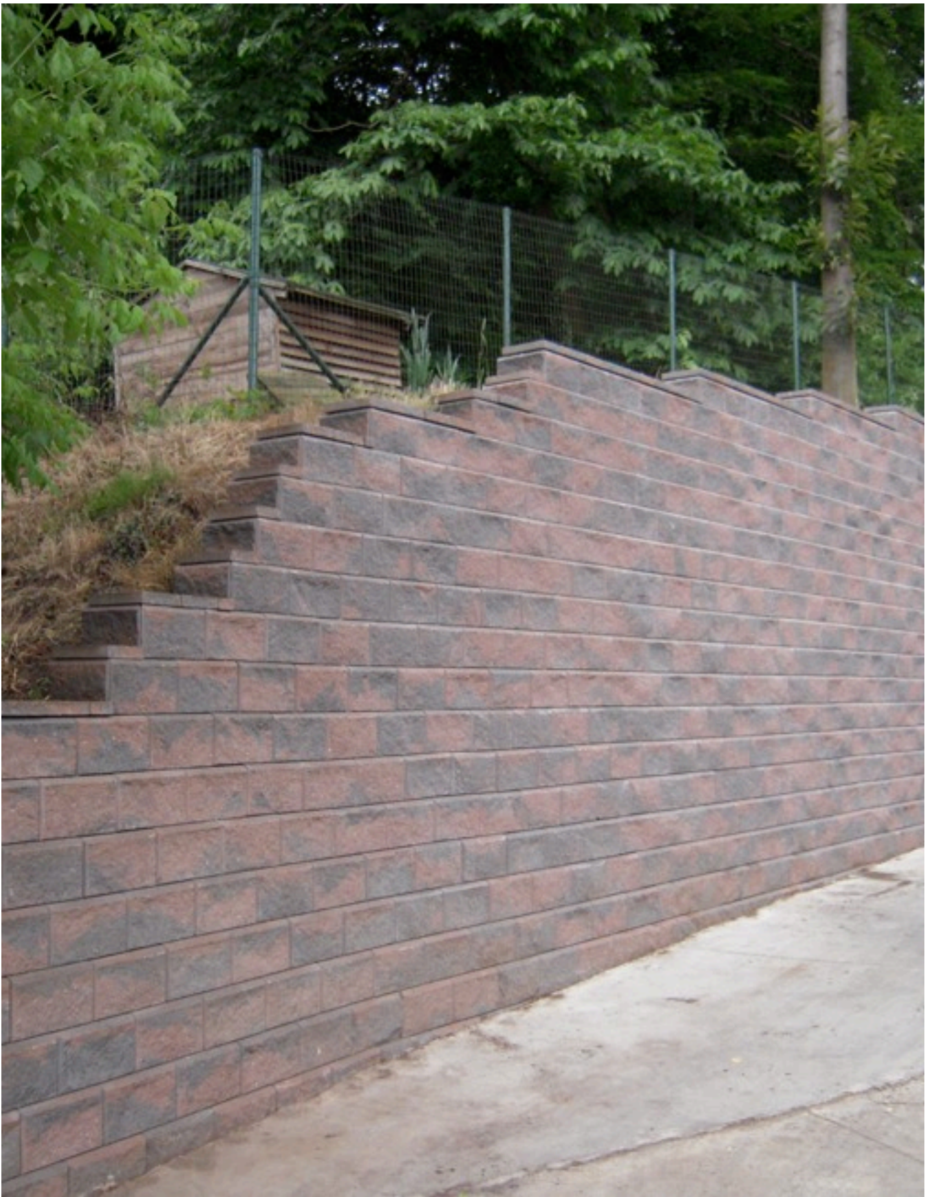
Sint - Joris - Winge (B)