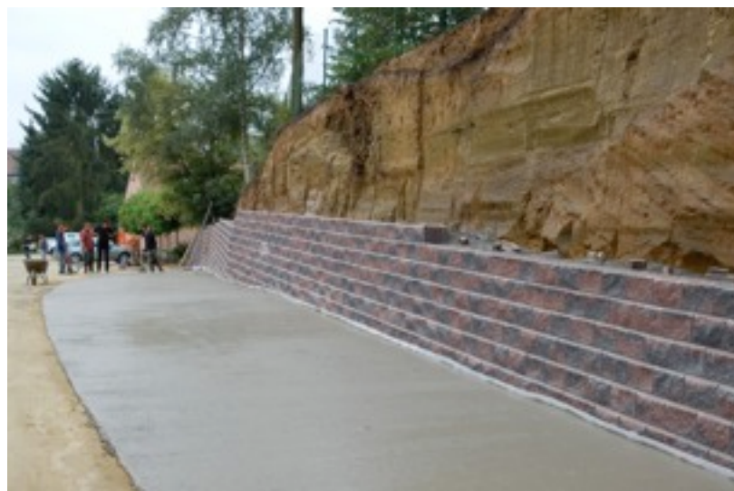
Totaal 250 m 2 Allan Blocks Maximaal kerende hoogte 5,00 m